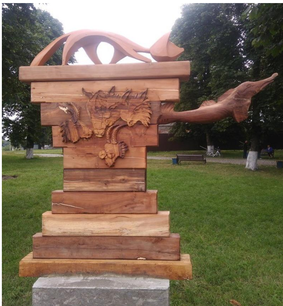
Парк скульптур за байками Л.Глібова в Чорному Острові