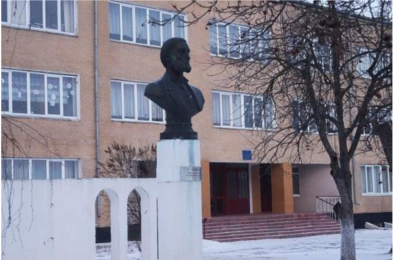
Погруддя Л.Глібова в Чорному Острові